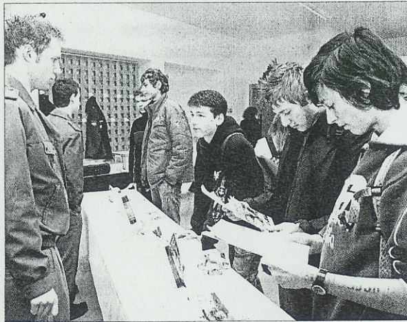
Für die Ausbildungsmöglichkeiten der Bundeswehr interessieren sich meistens nur die Jungen.

Die Schüler der Haupt- und Realschulen sowie Gymnasien konnten sich über rund 40 Ausbildungsberufe informieren. Dabei fanden es die Schüler durchweg gut, dass sie sich mit den Azubis selbst unterhalten konnten. „Die Azubis kommen uns ihre Erfahrungen erzählen und vielleicht, auch ein paar Tipps für die Bewerbung geben“, sagte eine Schülerin. Für Fragen zum Inhalt, der